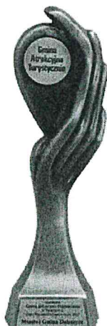
Gmina Atrakcyjna Turystycznie w Plebiscycie „Orły Polskiego Samorządu 2017”