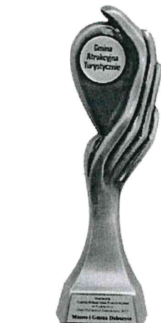
Gmina Atrakcyjna Turystycznie w Plebiscycie „Orły Polskiego Samorządu 2017”