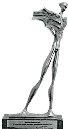
Nagroda „Wędrowiec Świętokrzyski” za zasługi dla rozwoju turystyki w Województwie Świętokrzyskim