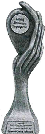
Gmina Atrakcyjna Turystycznie w Plebiscycie „Orły Polskiego Samorządu 2017”