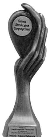
Gmina Atrakcyjna Turystycznie w Plebiscycie „Orły Polskiego Samorządu 2017”