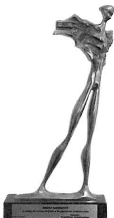
Nagroda „Wędrowiec Świętokrzyski” za zasługi dla rozwoju turystyki w Województwie Świętokrzyskim