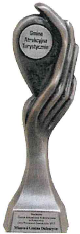
Gmina Atrakcyjna Turystycznie w Plebiscycie „Orły Polskiego Samorządu 2017”