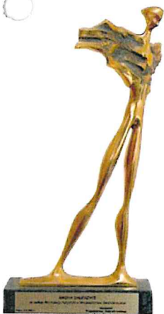
Nagroda „Wędrowiec Świętokrzyski” za zasługi dla rozwoju turystyki w Województwie Świętokrzyskim