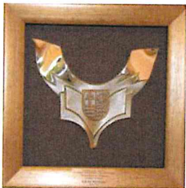
Nominacja do nagrody "Świętokrzyska Victoria" w kategorii "Samorządność" Kielce 2016