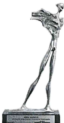
Nagroda „Wędrowiec Świętokrzyski” za zasługi dla rozwoju turystyki w Województwie Świętokrzyskim