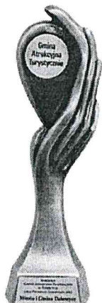
Gmina Atrakcyjna Turystycznie w Plebiscywie „Orły Polskiego Samorządu 2017”