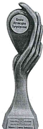
Gmina Atrakcyjna Turystycznie w Plebiscytcie „Orły Polskiego Samorządu 2017”

Działając na podstawie art. 10 ust. 1 i art. 13 ustawy z dnia 11 lipca 2014 r. o petycjach (t.j. Dz. U. z 2018 r., poz. 870) uprzejmie informuję, że w związku z podpisanymi i obowiązującymi Gminę umowami z operatorem sieci komórkowej, obecnie nie znajdujemy podstaw do ich zrywania. Dodaję, że rozwiązanie umowy skutkować będzie wypłaceniem przez Gminę kar umownych.