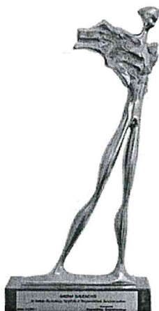
Nagroda „Wędrowiec Świętokrzyski” za zasługi dla rozwoju turystyki w Województwie Świętokrzyskim