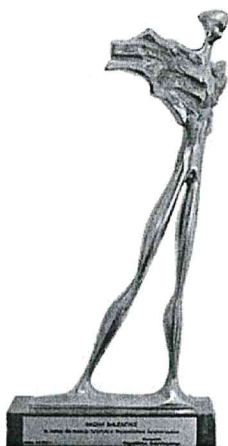
Nagroda „Wędrowiec Świątokrzyski” za zasługi dla rozwoju turystyki w Województwie Świątokrzyskim

Działając na podstawie art. 10 ust. 1 i art. 13 ustawy z dnia 11 lipca 2014 r. o petycjach (t.j. Dz. U. z 2018 r., poz. 870) uprzejmie informuję, że aktualnie nie jest planowane postępowanie przetargowe w obszarze wymiany taboru pojazdów służących utrzymaniu czystości i porządku w Gminie. Tut. organ nie jest w stanie również określić przybliżonego terminu organizacji takiego przetargu.