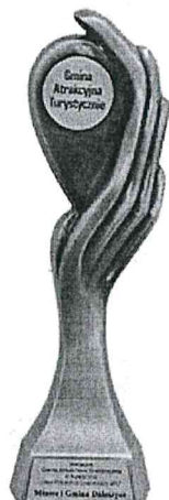
Gmina Atrakcyjna Turystycznie w Plebiscycie „Orły Polskiego Samorządu 2017”