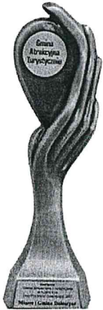
Gmina Atrakcyjna Turystycznie w Plebiscywie „Orły Polskiego Samorządu 2017”